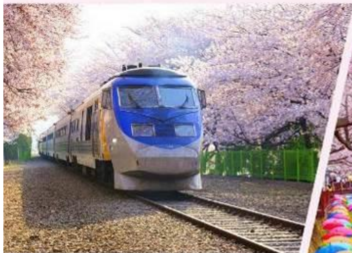
慶和火車站，路軌兩旁種滿了櫻花樹，景緻優美，是不少韓劇的取景處。