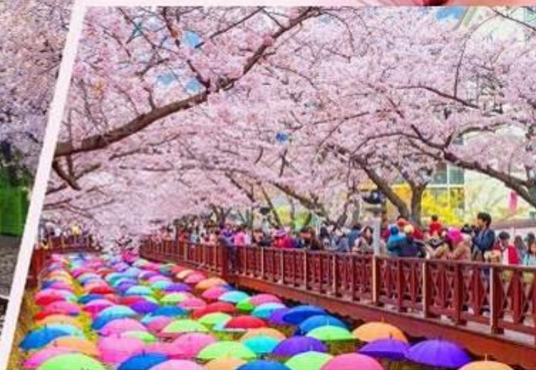
余佐川，曾是MBC電視臺戲劇《羅曼史》主要拍攝取景地，以身為鎮海賞櫻聖地為名。