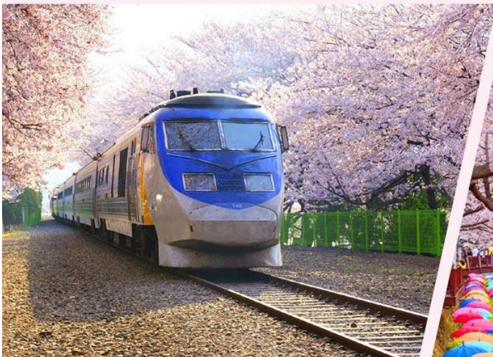
慶和火車站，路軌兩旁種滿了櫻花樹，景緻優美，是不少韓劇的取景處。