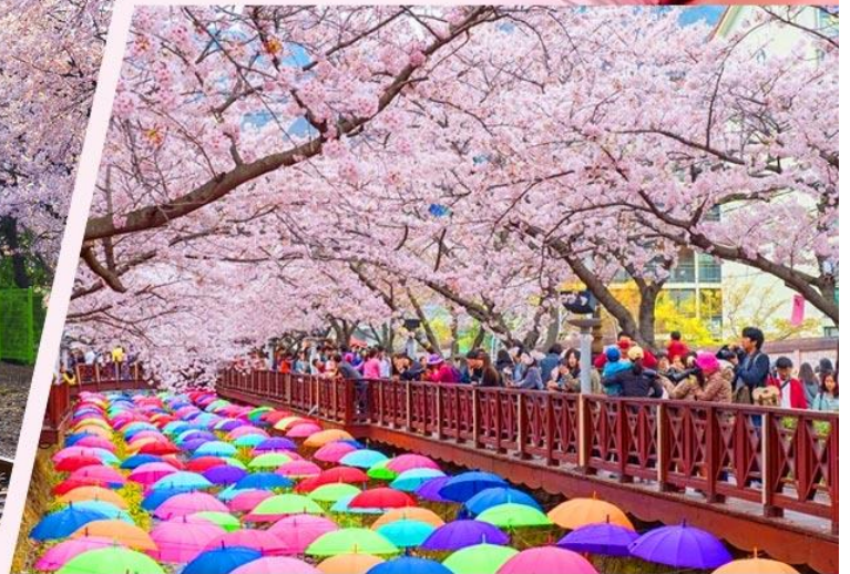
余佐川，曾是MBC電視臺戲劇《羅曼史》主要拍攝取景地，以身為鎮海賞櫻聖地為名。