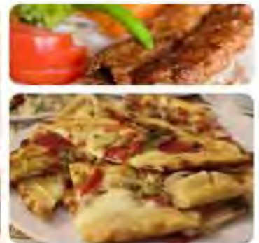
以上圖片僅供參考