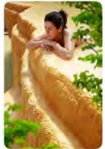
以上圖片僅供參考