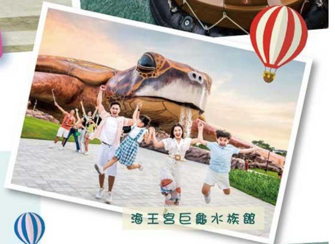
海王宮巨龜水族館