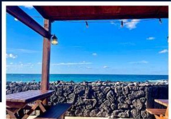
超級海景霸氣龍蝦之家 (兩人一隻+炒飯)