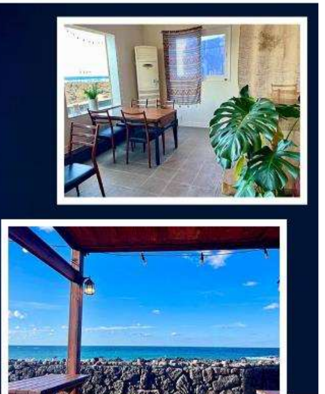
超級海景霸氣龍蝦之家 (兩人一隻+炒飯)